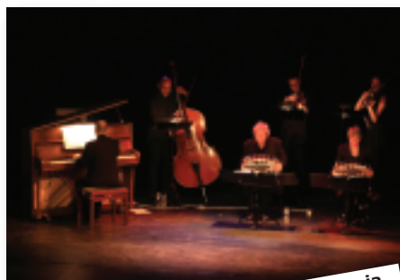
Sexteto Loca Bohemia