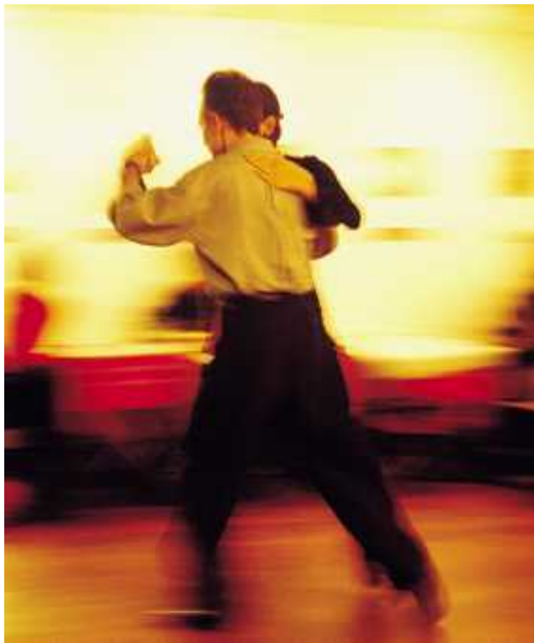
FROUMENT F. JURBA IMAGES SERVER

Malheureusement la dictature militaire qui sévit dans ce pays jusque dans les années 1970 voit d'un mauvais œil cette activité un peu trop subversive à leur goût et les danseurs sont persécutés. Il faut attendre la décennie suivante pour assister à son renouveau, grâce à la volonté de producteurs et d'artistes qui créent le spectacle Tango argentino , dont la tournée mondiale sonne l'heure de la renaissance de ce qui va devenir un véritable phénomène de mode. Comme une soixantaine d'années auparavant, quand les marins ar-