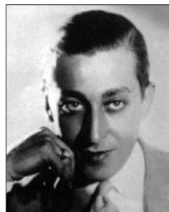
P. 20 JULIO DE CARO