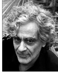
P. 10 MELINGO