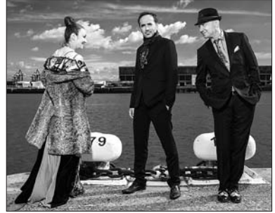
P. 10 PLAZA FRANCIA