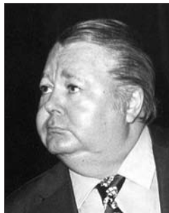
P. 22 ANÍBAL TROILO