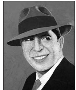
P. 14 CARLOS GARDEL